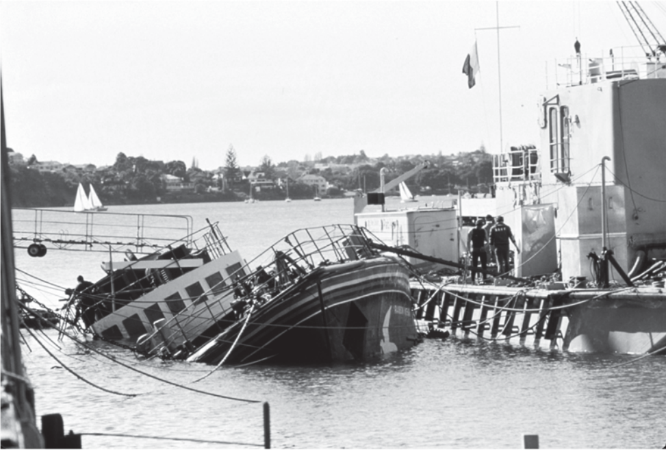
سفينة جماعة السلام الأخضر رينبو وارير الغارقة في خليج أوكلاند، نيوزيلاندا، أغسطس، 1985

الفرنسية بإغراق سفينة السلام الأخضر "رينبو وارير" عند رسوها في أوكلاند بنيوزيلاندا، وذلك لمنعها من التدخل لمنع التجارب النووية في جنوب المحيط الهادئ، ومن حيث الطريقة التي تنفذ بها منظمات المجتمع المدني الوظائف الدبلوماسية المحورية في التمثيل والاتصال فإنها تشبه في أوجه عدة أنواع المنظمات المشتغلة بالدبلوماسية والتي ذكرناها في الفصول السابقة مثل الحكومات والمنظمات متعددة الأطراف والشركات العالمية الكبرى.